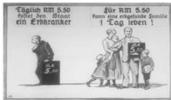
Propagande nazi contre les personnes handicapées qui coûtent chers à l'état.

Les théories décoloniales remettent en question cet héritage historique et actuel du colonialisme et de l'exploitation par les Européens blancs valides (Mendoza, 2020). Une véritable décolonisation nécessite également de prendre en compte le handicap et son intersection avec la race (source : LSE )